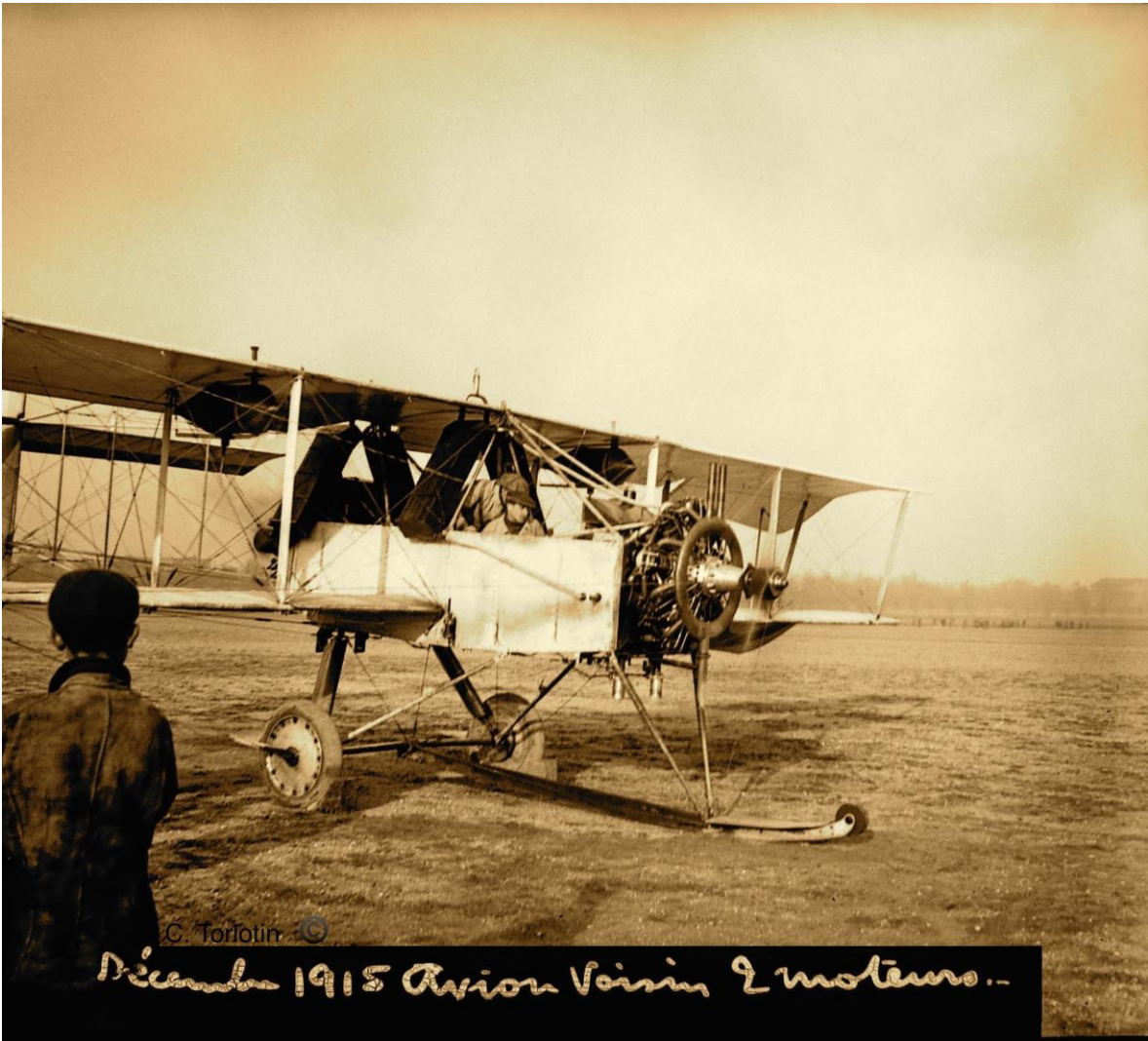
Rare ! Avion Voisin 2 moteurs « push-pull »