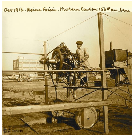
Octobre 1915 – Moteur Canson 150 cv au banc