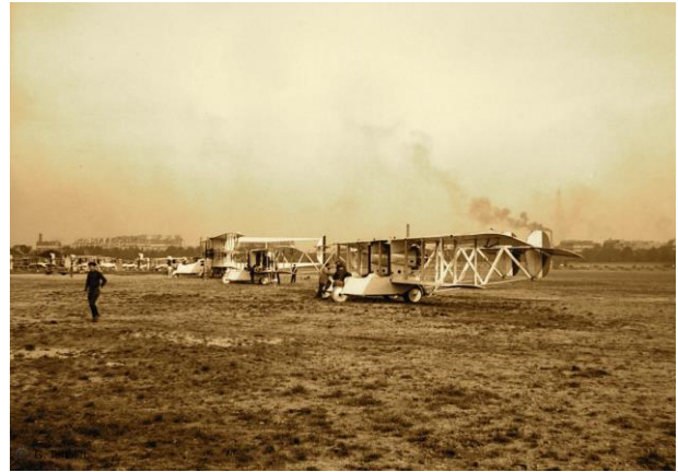
Septembre 1915 – Bi moteur Voisin – Moteurs Canton