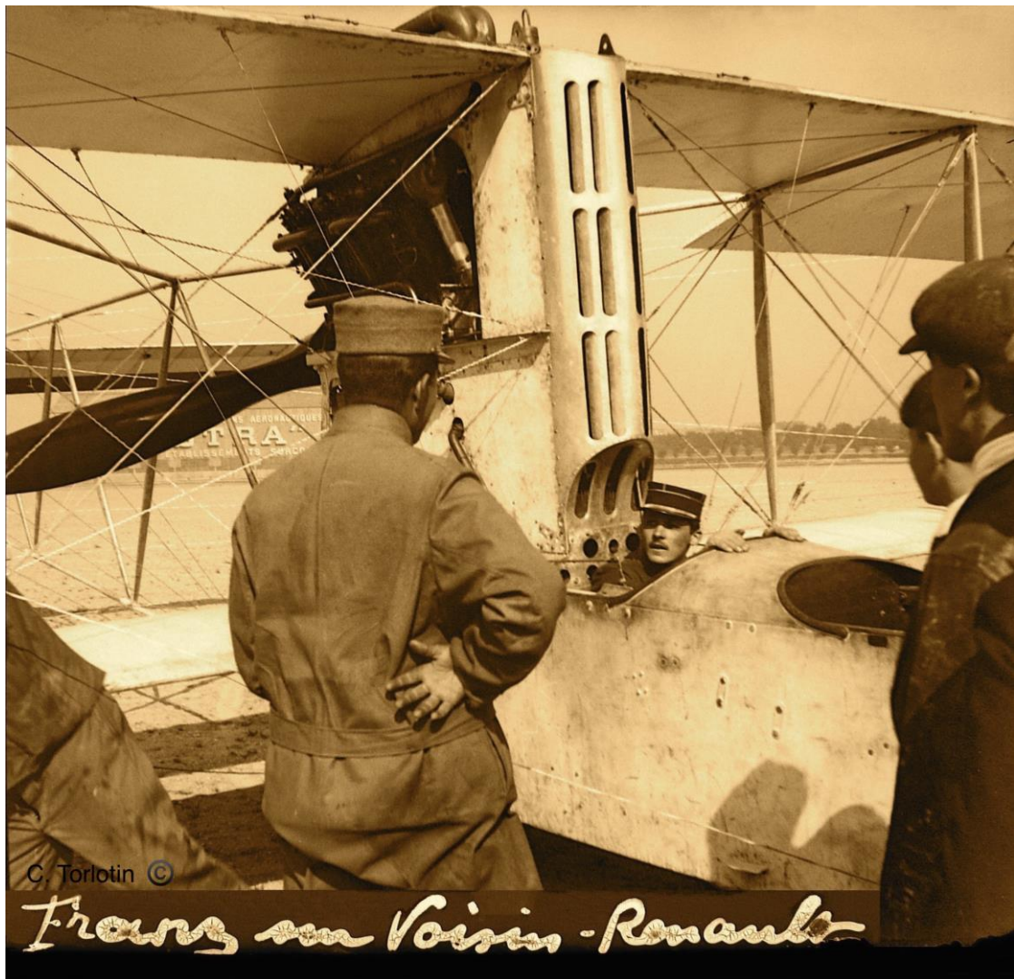
Franz sur Voisin – Renault 220 cv