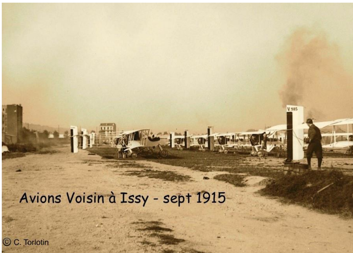
Avions Voisin à Issy les Moulineaux en septembre et octobre 1915