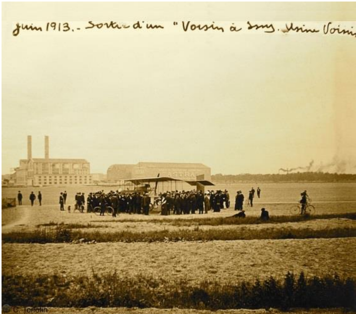
Sortie officielle d'un nouveau modèle Voisin à Issy les Moulineaux