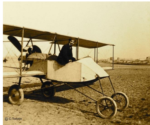
Le Voisin Type III bien connu